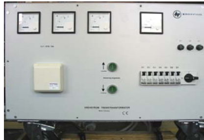
5317.21 mit Motorsteuerung